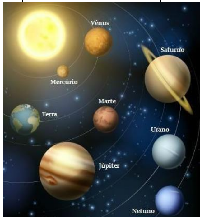
Representação do Sistema Solar.

3. Terra - Terceiro planeta do sistema solar a partir do Sol, o planeta Terra é rochoso, com atmosfera gasosa e temperatura média de 15°C. Possui um satélite natural, a lua, e a quantidade de água existente no planeta,